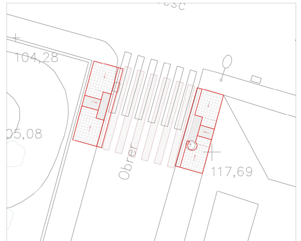
E M P L A Ç A M E N T