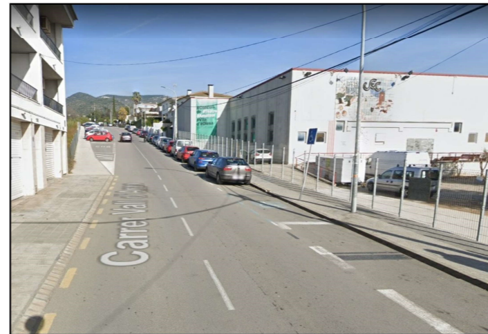
INICI CARRER VALL D'ARAN

Pressupost: PREU ESTIMAT: _____ 50.000 €