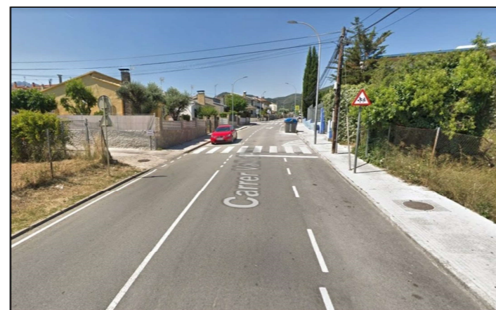
CARRER VALL D'ARAN / CARRER EMPORDÀ